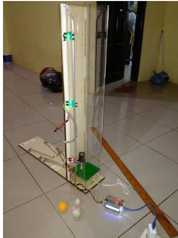
Gambar 1. KIT HKEM untuk posisi gerak jatuh bebas dan gerak vertikal ke atas