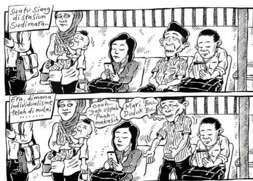
Gambar 20. halaman 47 strip komik Indonesia Banget! 2

Sumber daya : Halaman 47 Strip Komik Indonesia Banget! 2