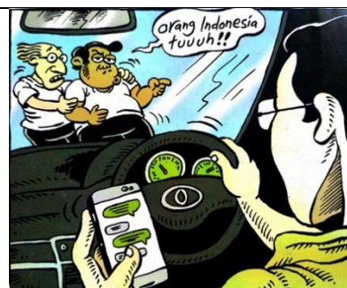
Gambar 11. panel pertama halaman pembuka strip komik Indonesia Banget! 2

Sumber daya: Panel Pertama dalam Halaman Pembuka pertama