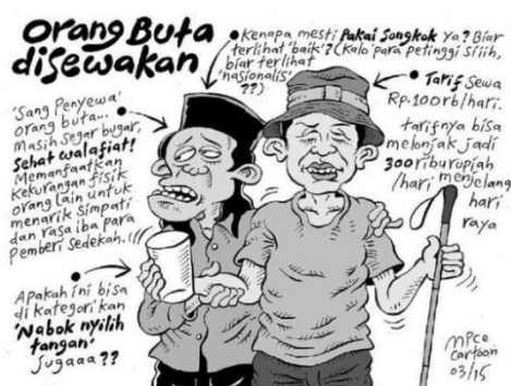
Gambar 17. halaman 6 strip komik Indonesia Banget! 2

Sumber daya: Halaman 6 strip komik Indonesia Banget! 2