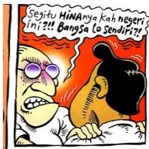
Gambar 10. Balon kata dengan penekanan pada penebalan kata (bold)

dalam balon kata. Dalam panel tersebut ia memprotes Indonesia Banget yang diucapkan oleh aktor Leon secara berulang-ulang. Dalam balon kata terdapat aspek paralinguistik berupa penekanan dalam kata "CAP" yang ditulis menggunakan huruf kapital serta dicetak tebal. Artinya Orang Indonesia adalah cap, dan cap adalah stereotip.