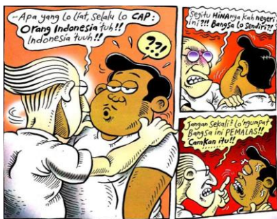
Gambar 16. halaman pembuka keempat strip komik Indonesia Banget! 2

Sumber Daya: Panel Pertama, Kedua, dan Ketiga Halaman Pembuka Keempat