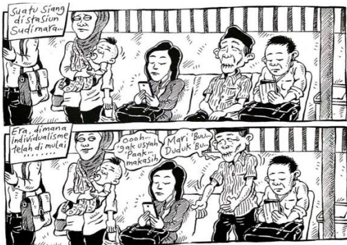
Gambar 8. Strip komik halaman 47 Indonesia Banget! 2

Strip komik selanjutnya menggambarkan wacana strip komik sebagai representasi ketidakpedulian. Strip komik tersebut menggambarkan dua orang aktor yang menggunakan telepon pintarnya dan mengenakan perangkat headset yang menutupi kedua telinganya. Hal tersebut mengkonstruksi wacana mengenai era individualisme yang dituliskan dalam narasi panel kedua dalam strip komik. Era individualisme erat kaitannya dengan kalimat “orang Indonesia” yang ada dalam panel-panel sebelumnya. Orang Indonesia yang dirujuk adalah aktor dengan individualisme yang digambarkan dalam strip komik, yaitu orang-orang yang duduk dan sedang memperhatikan telepon pintarnya.