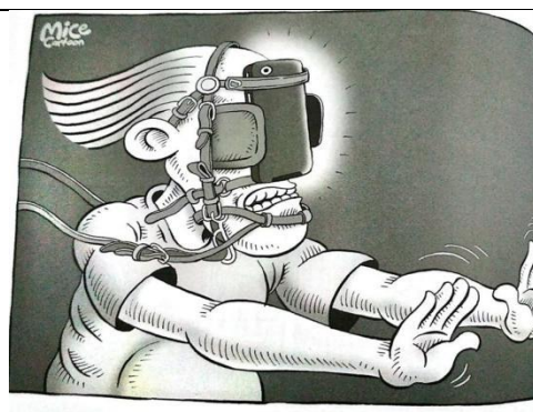
Gambar 7. strip komik halaman 32

Stereotip atau cap Orang Indonesia juga terdapat dalam strip komik "Dulu" dan "Kini". Dalam panel "Dulu", istilah Dulu adalah ruang dan waktu yang diharapkan dan diekspektasikan indah oleh aktor dan pembaca. Sedangkan "Kini" ruang dan waktu masa kini yang tidak diharapkan. Hal tersebut mengkonstruksi sebuah wacana bahwa ruang dan waktu Dulu lebih baik daripada sekarang. Anak-anak yang bermain di luar rumah adalah sesuatu yang dianggap ideal. Sedangkan anak-anak yang bermain gawai dalam 'Kini' adalah sesuatu yang dianggap tidak ideal.