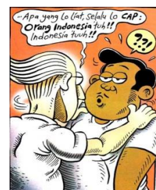
Gambar 9. Balon kata dengan penekanan pada penebalan kata ( bold )

adalah sebuah metonimi bagi orang Indonesia yang memiliki ketidaksesuaian dengan wacana hidup. Ketidaksesuaian tersebut berasal dari beberapa referensi artikel yang berkaitan dengan ilustrasi strip komik. Wacana “orang Indonesia” yang disebutkan secara berulang-ulang berujung pada konstruksi ideologi. Konstruksi Ideologi tersebut berkaitan dengan judul kumpulan strip komik yaitu “Indonesia Banget!”. Indonesia Banget adalah sebuah ideologi yang di dalamnya berisi wacana-wacana tentang orang Indonesia yang dianggap mempunyai sifat negatif atau menyimpang. Kategorisasi tersebut didapat berdasarkan analisis anatomi wacana dalam setiap panel strip komik. Sikap maupun aksi aktor dalam strip komik digambarkan “Indonesia Banget”, baik secara langsung disampaikan oleh aktor Leon maupun melalui gagasan strip komik.