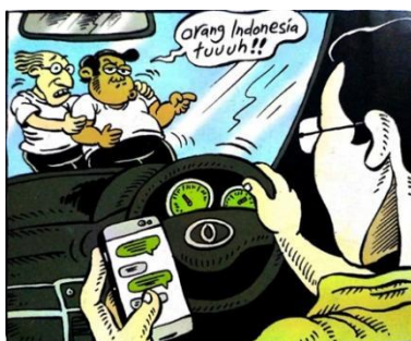
Gambar 4. Panel pertama halaman pembuka pertama strip komik Indonesia Banget! 2

Dalam panel tersebut, secara jelas Leon mengucapkan bahwa Indonesia jorok dan kumuh. Hal tersebut dipertegas lagi dengan adanya penebalan dalam tanda baca setelah jorok dan kumuh. Selain penggambaran sifat secara langsung, dalam panel halaman pembuka, Leon mengucapkan kembali dalam balon kata "...Dasar Orang Indonesia!". Perkataan tersebut merupakan wacana mengenai "Orang Indonesia" yang gemar bergosip.