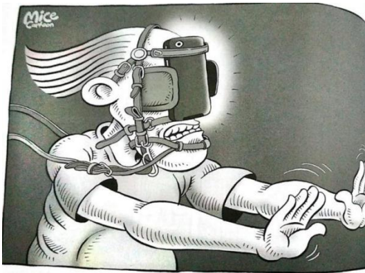
Gambar 10. halaman 32 strip komik Indonesia Banget! 2

Sumber daya : Halaman 32 Strip Komik Indonesia Banget! 2