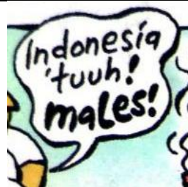
Gambar 2. Balon kata dengan penekanan pada penebalan kata (bold)

Ucapan dalam balon kata tersebut digambarkan secara berulang-ulang dalam panel pembuka. Terdapat enam balon kata yang menggambarkan dialog tokoh Leon yang diucapkan secara berulang-ulang. Beberapa panel diantaranya mengucapkan secara jelas wacana apa diungkapkan dalam strip komik. Seperti pada gambar 3 yaitu balon kata berisi “Indonesia ‘tuuh! Males!” yang diucapkan oleh Leon. Ucapan Leon dalam balon kata tersebut mengkonstruksi bahwa (orang) Indonesia itu memiliki sifat pemalas. Dalam panel lain, Leon juga mengucapkan komentarnya mengenai orang Indonesia yang ditulis dengan metonimi ‘Indonesia’.