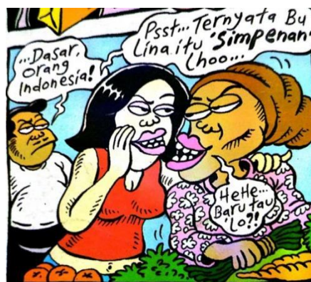
Gambar 14 panel keempat halaman pembuka strip komik Indonesia Banget! 2

Sumber daya : panel keempat halaman pembuka pertama strip komik