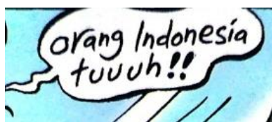
Gambar 1. Balon kata dengan penekanan pada tanda baca

Secara garis besar, strip komik menggambarkan wacana “Orang Indonesia”. Wacana tersebut mengkritisi segala aksi dan sikap yang dilakukan oleh aktor yang ada dalam panel. Dalam beberapa judul strip komik bagian pembuka, Leon memberikan ucapan yang merupakan kunci dari keseluruhan isi strip komik. Ucapan tersebut dituliskan dalam balon kata yang di dalamnya terdapat aspek parabahasa, yaitu penekanan. Penekanan yang terdapat di dalamnya berupa tanda baca dan penebalan huruf.