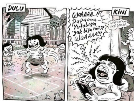
Gambar 6. strip komik berjudul Dulu dan Sekarang

berisi cap atau penilaian aktor terhadap 'orang Indonesia' yang dilihatnya. Cap tersebut tidak jauh berbeda dengan stereotip orang Indonesia yang digambarkan dalam gagasan strip komik.