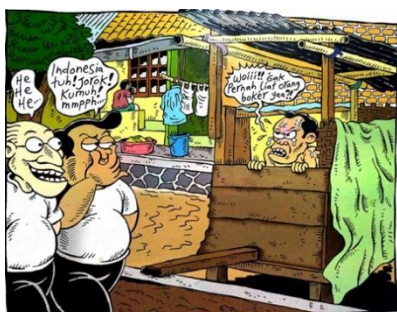
Gambar 15. halaman pembuka kedua strip komik Indonesia Banget! 2

Sumber Daya : Panel Komik Halaman Pembuka Kedua Strip Komik