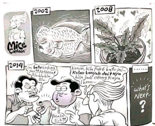
Gambar 19. halaman 22 strip komik Indonesia Banget! 2

Sumber daya : Halaman 22 strip komik Indonesia Banget!2