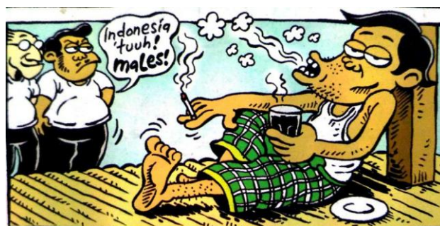
Gambar 13 panel ketiga halaman pembuka strip komik Indonesia Banget! 2

Sumber Daya : Panel Ketiga Halaman Pembuka Pertama