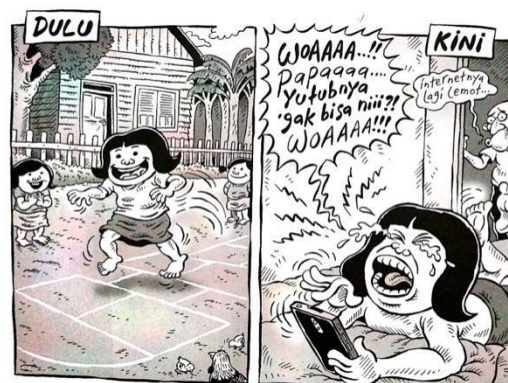
Gambar 18. halaman 15 strip komik Indonesia Banget! 2

Sumber daya : Halaman 15 Strip Komik Indonesia Banget!2