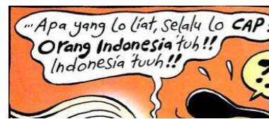
Gambar 5. balon kata yang menyatakan cap Orang Indonesia

Selain melalui perkataan "Orang Indonesia" atau "Indonesia", wacana dalam strip komik juga dipahami melalui anatomi wacana dalam strip komik. Seperti halnya dalam panel pertama yang menggambarkan orang Indonesia sebagai representasi ketidakpedulian terhadap lalu lintas. Aturan lalu lintas menyebutkan adanya wacana larangan berkendara menggunakan telepon pintar. Ungkapan "Orang Indonesia itu" menunjukkan kecenderungan aktor yang negatif. Makna negatif adalah aktor yang melanggar wacana mengenai berlalu lintas dengan benar.