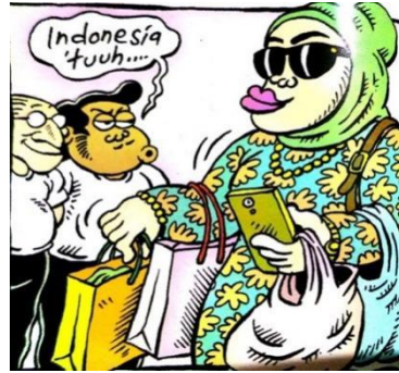
Gambar 12. panel kedua halaman pembuka strip komik Indonesia Banget! 2

Sumber daya : Panel Kedua Halaman Pembuka Pertama