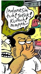
Gambar 3 balon kata yang diucapkan oleh Leon mengenai Indonesia

Dalam panel tersebut, secara jelas Leon mengucapkan bahwa Indonesia jorok dan kumuh. Hal tersebut dipertegas lagi dengan adanya penebalan dalam tanda baca setelah jorok dan kumuh. Selain penggambaran sifat secara langsung, dalam panel halaman pembuka, Leon mengucapkan kembali dalam balon kata "...Dasar Orang Indonesia!". Perkataan tersebut merupakan wacana mengenai "Orang Indonesia" yang gemar bergosip.