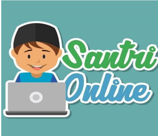
Gambar 2 Profil Fanpage Santrionline.

eksternalnya. Berdasarkan visi dan misi Santrionline menduga sebagai media santri nusantara di mata khalayak.