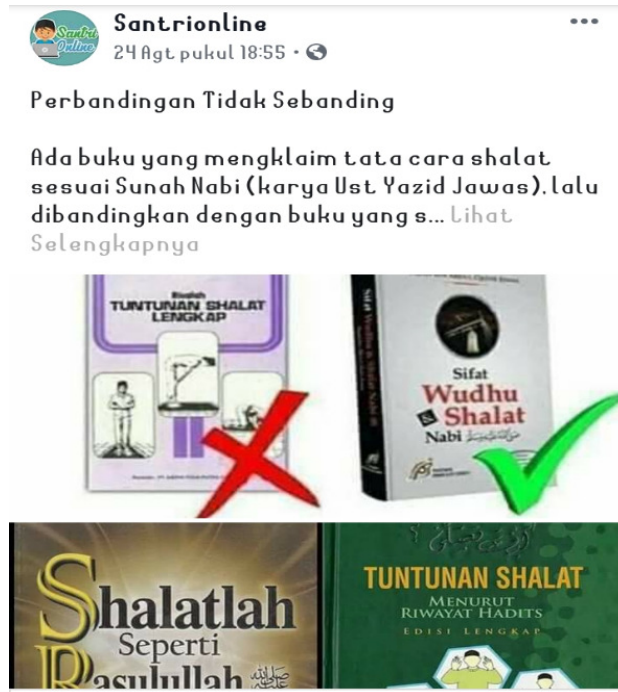
Gambar 1. Postingan hoax . Sumber: Fanpage Santrionline

kan rangkuman dari kitab Majmu' atau Raudlah karya Imam Nawawi, sedangkan kitab karya Ustadz Yazid Jawas tidak bisa dibandingkan dengan Majmu'. Seharusnya kitab karya Ustadz Jawas dibandingkan dengan Taqrib agar memiliki perbandingan yang seimbang.