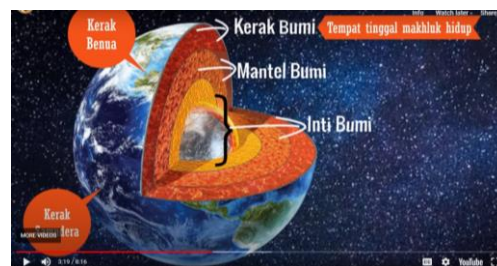
Gambar 2. Lapisan Bagian Litosfer