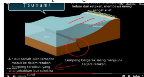
Gambar 4. Terjadinya Stunami