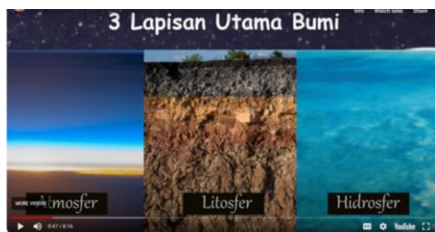
Gambar 1. 3 Lapisan Utama Bumi

Pada penelitian ini menggunakan video fenomena alam pada pembelajaran IPA materi lapisan bumi untuk menstimulus kreativitas ilmiah siswa. Adapun beberapa gambar substansi isi video disajikan pada gambar 1, 2, 3, 4,5,dan 6;