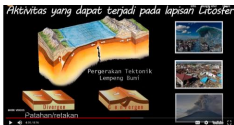
Gambar 3. Aktivitas pada Litosfer