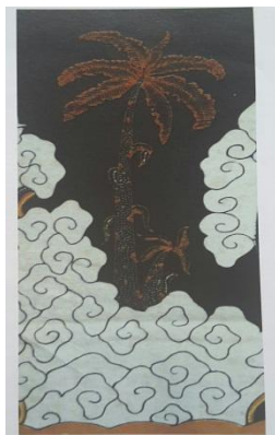
Batik Wadanan Trusmi Cirebon Gambar C.5 Motif Batik (Dilatasi)

telah menggambarkan dengan jelas bahwa konsep-konsep transformasi telah diterapkan. Selain tindakan-tindakan ini, juga dapat dilakukan tindakan-tindakan lainnya seperti menyalin sketsa kedalam ukuran yang lebih kecil atau lebih besar, yang selanjutnya digunakan untuk membuat motif batik yang utuh. Sebagai contoh motif batik pada Gambar C.5. Pada Gambar dibawah ini, motif pada gambar helai bunga digeser kemudian diperbesar, sehingga diperoleh motif batik yang utuh seperti Gambar C.5. 90 derajat, 180,derajat 270 derajat, 360derajat