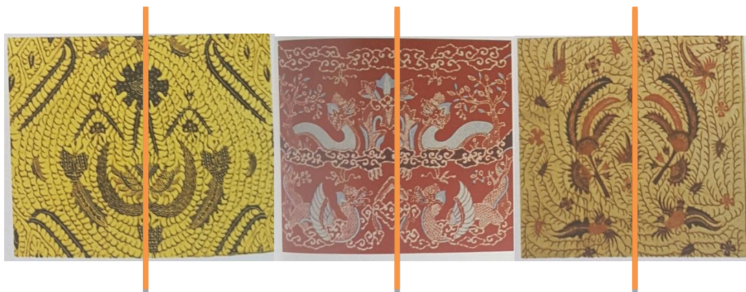
Batik Sawat Riwe