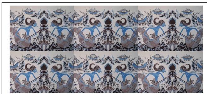
Batik Wayang Cirebon

Sebagai contoh yaitu Gambar C.6. Pada Gambar ini, batik tersebut terdiri dari motif batik yang kongruen satu sama lain.