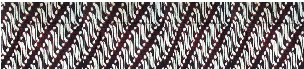
Batik Liris Trusmi Cirebon

a ----- a' ----- a'' ----- a''' ----- a''''