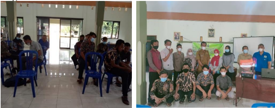
Gambar 2. Kegiatan Seminar

Pengelola Bumdes yang hanya dua orang tentunya tidak efektif. Beberapa unit-unit usaha Bumdes Rizki Amanah adalah loket pembayaran listrik dan air, took kelontong (baru tutup karena pandemi), Persewaan lapangan bulu tangkis serta Koperasi Simpan Pinjam yang bernama Simpanan Amanah. Diharapkan dengan adanya tambahan pengelola, Bumdes berkembang pengelolaan sehingga potensi desa tergali.