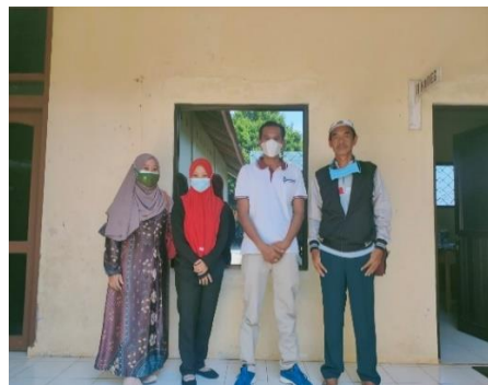
Gambar 1 asesment lapangan dengan Kepala Desa 'Tambahrejo