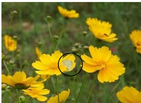
Gambar 1. Kupu-kupu mengunjungi bunga untuk mencari nektar

Berdasarkan hasil peneltian, jenis tanaman berbunga Merangin Garden ditemukannya sebanyak 16 spesies dari 11 famili yang secara keseluruhan didominasi oleh famili Asteraceae (Tabel 1). Famili Asteraceae merupakan salah satu famili tumbuhan yang disenangi oleh kupu-kupu kelompok famili Nymphalidae (Alfida dkk, 2016), hal ini dikarenakan famili asteraceae memilki sumber nektar bagi kupu-kupu.