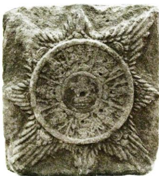
Gambar 1. Surya Majapahit

Di dalam Serat Sundarigama dan Kitab Suci Weda, Nawa Dewata ini sebagai manifestasi Tuhan yang menguasai dan menjaga alam semesta (Utami & Manuaba 2017). Merekalah yang menjadi penghubung antara Tuhan dan ciptaan-Nya, sebagai tangan kanan Tuhan untuk ketentraman alam dan seisinya dengan memusnahkan berbagai kejahatan dari segala penjuru serta meleburkan segala keburukan yang ada di muka bumi ini.