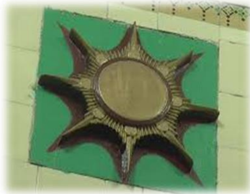
Gambar 4. Surya Majapahit jarak dekat

masjid selain karena ada makna dan pesan di dalamnya. Dan tidak mungkin hanya sekadar hiasan sebagaimana bedhug yang diambil pemanfaatannya untuk alat panggilan adzan.