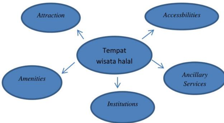
Gambar 1. Ilustrasi kontruksi sistem pengembangan tempat wisata syariah

Keempat , fasilitas Pendukung (Ancillary Services), adalah ketersediaan fasilitas pendukung yang digunakan oleh wisatawan. Fasilitas pendukung tersebut meliputi bank, telekomunikasi, pos, rumah sakit dan fasilitas lainnya. Kelima , kelembagaan (Institutions), yaitu keberadaan serta peran dari masing-masing unsur yang mendukung terlaksananya kegiatan pariwisata, termasuk masyarakat setempat sebagai tuan rumah (host).