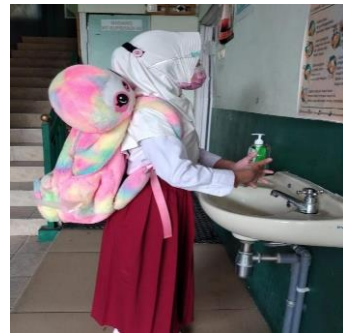
Gambar 2. Mencuci Tangan

Peserta didik SD Supriyadi Semarang sebelum masuk ke sekolah melakukan pengecekan suhu badan terlebih dahulu kemudian sebelum memasuki kelas juga diwajibkan mencuci tangan dengan sabun terlebih dahulu.