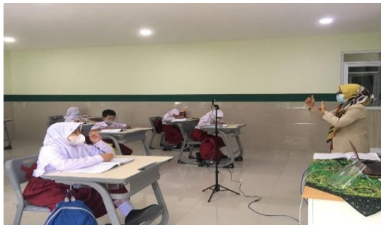
Gambar 5. Pembelajaran Kelas Lima

memberikan tugas yang dikumpulkan di google classroom . Kelima, guru menutup pembelajaran dengan berdoa. 18