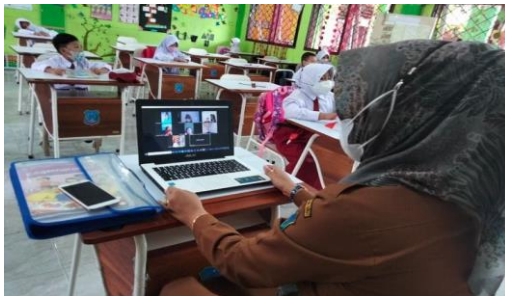
Gambar 6. Pembelajaran Kelas Enam

Selain itu, pengamatan proses pembelajaran juga dilakukan pada guru 3 di kelas 6 SD Supriyadi Semarang. Pembelajaran dimulai dari jam 07.30-10.30 kegiatan dilakukan oleh guru. Pertama , sebelum memulai pembelajaran guru menginformasikan dan membagikan link zoom pada peserta didik kelas online lewat WA grup dan guru membuka kelas dengan salam. Kedua , guru melakukan absensi pada kelas offline dan online. Ketiga , menyapa dan memberikan motivasi pada siswa sebelum pembelajaran dimulai. Keempat , guru langsung masuk pada materi pembelajaran dengan menjelaskan materi yang ditayangkan di layar berupa power point (PPT) yang telah guru buat. Kelima , peserta didik diberikan kesempatan untuk bertanya. Pada sesi ini terdapat 4 siswa kelas 6 yang bertanya 2 dari kelas offline dan 2 dari kelas online dan terjadilah proses diskusi di kelas. Setelah semua pertanyaan sudah terjawab akhirnya guru memberikan tugas meresum yang dikumpulkan di google classroom . Keenam , guru menutup pembelajaran dengan berdoa. 20