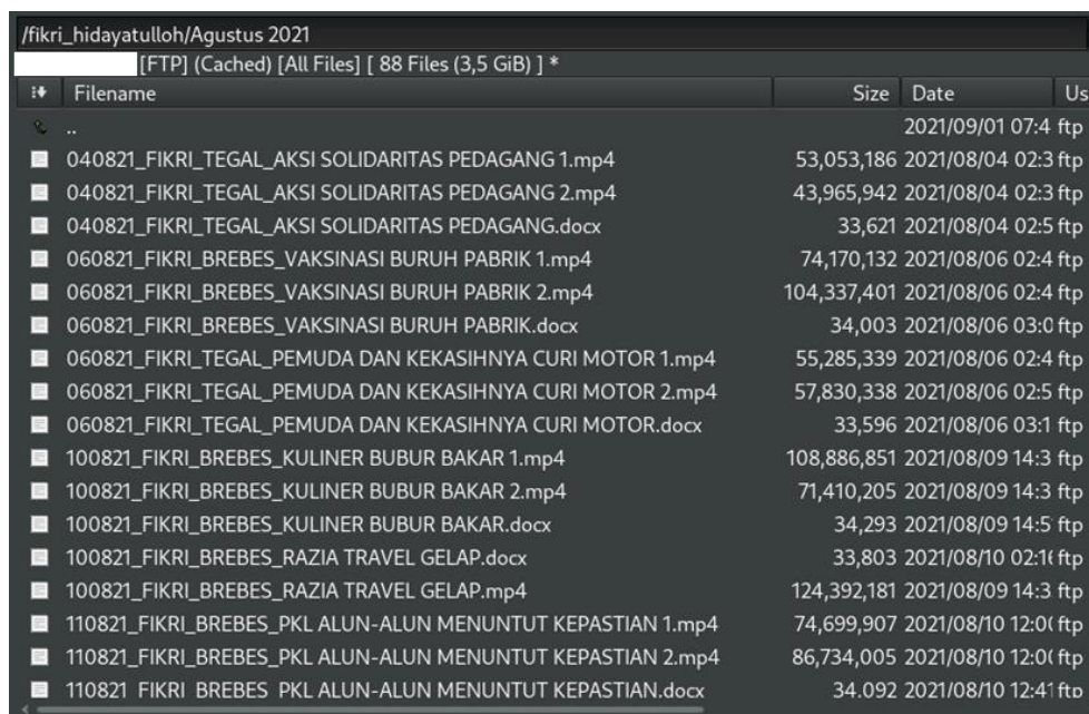
Gambar 3. Sistem Digunakan

Setelah media pengiriman informasi berhasil dibuat dan dikonfigurasi dengan benar serta sudah dilakukan sosialisasi penggunaannya, maka sistem pengiriman informasi dapat digunakan. Berikut adalah gambaran ketika sistem pengiriman informasi sudah dapat digunakan: