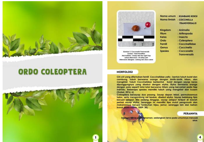
Gambar 2. Halaman Isi Katalog