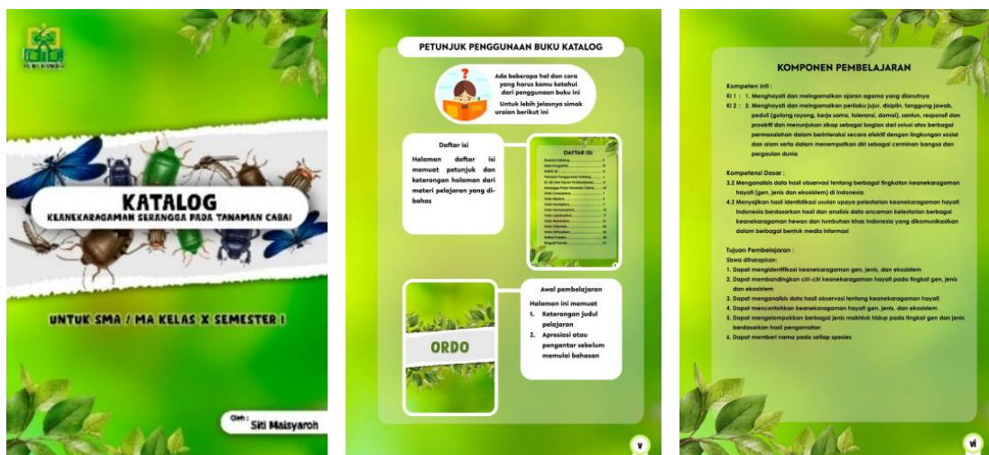
Gambar 1. Halaman Pendahuluan Katalog

Katalog yang dikembangkan disesuaikan dengan Kompetensi Dasar dan Indikator yang telah ditetapkan. Katalog tersebut berisikan judul, petunjuk penggunaan, Kompetensi Inti, Kompetensi Dasar, materi pokok, dan referensi. Urutan serangga hasil identifikasi dibedakan per ordo sehingga lebih memudahkan siswa membedakan klasifikasi serangganya. Tiap halaman materi berisi gambar serangga, klasifikasi, penanan dan morfologi.